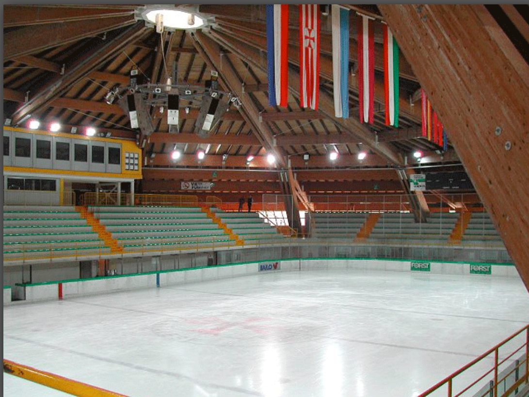
Lo Stadio del Ghiaccio di Cavalese, teatro dei Campionati Italiani Assoluti 2012

E' un immenso piacere accogliere con un caloroso saluto gli atleti, i tecnici e gli organizzatori delle finali del Campionato Italiano Assoluto di Curling a Cavalese. Ho seguito con grande curiosità l'ascesa di questo sport che, dopo aver entusiasmato la nostra vicina Val di Cembra, eccellente vivaio di campioni, si è dimostrato una vera e propria rivelazione delle Olimpiadi di Torino. Le gesta sportive di queste finali appassioneranno le tribune dello Stadio del Ghiaccio di Fiemme. Sono anche felice che i nostri studenti abbiano colto l'occasione per cimentarsi in un prestigioso torneo di curling alla vigilia di questo importante evento. Fiemme, una valle di grandi fervori sportivi, in questi mesi vive la febbricitante attesa della sua terza sfida mondiale: i Campionati del Mondo di Sci Nordico Fiemme-Trentino 2013. Queste finali di curling, quindi, saranno per tutti un momento di grande condivisione”.