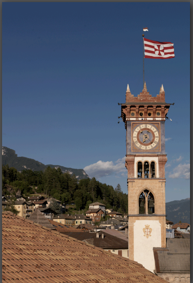
Cavalese e la Val di Fiemme