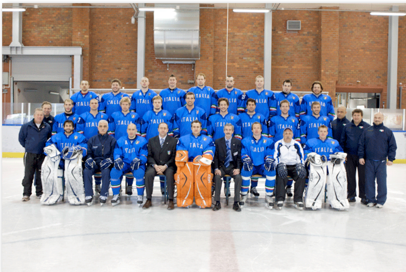
La Nazionale Italiana ai Campionati Mondiali Division I 2009 di Torun (Polonia)